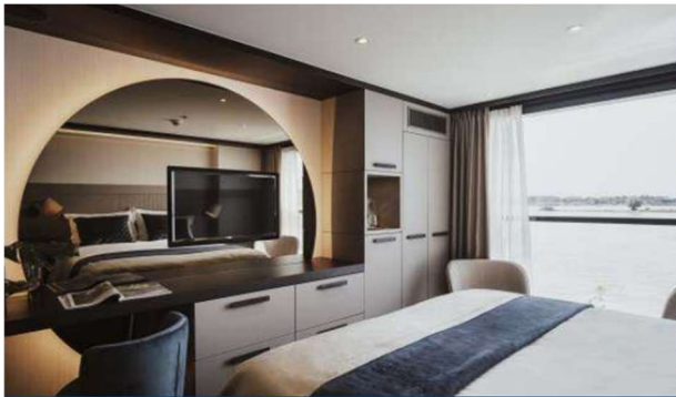
Cabin with horizontal sliding panorama windows