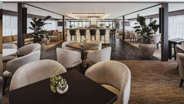
Lounge with Bar and outside front Terrace