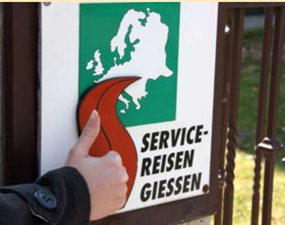
gefällt mir: www.facebook.com/Service.Reisen.Giessen