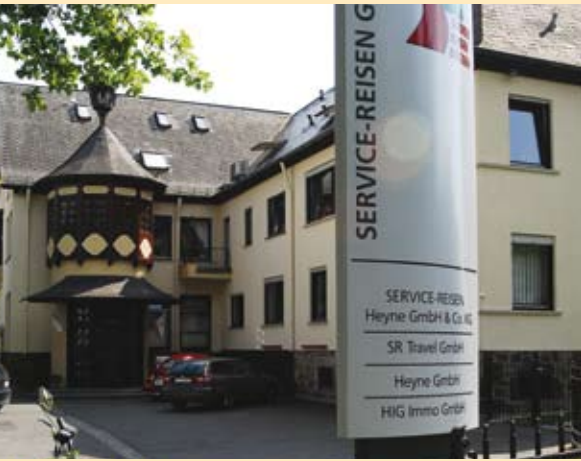
Rödgener Strasse 12, SRG-Zentrale

Über 135 Mitarbeiter in unseren Büros in Giessen sind gerne für Sie da!